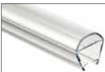
39.1330.4 Junta salvacantos