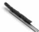
39.2068.0 Juego felpa para polvo (opcional)

Para un correcto funcionamiento del sistema, las medidas de la hoja deben seguir las pautas aconsejadas de mínimo y máximo de ancho y alto especificadas en la tabla.