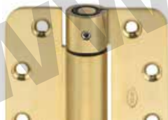
Titanium gold (IN.05.041.125.TG)