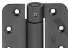
Titanium black (IN.05.041.125.TB)

Acabamentos especiais / Special finishes / Acabados especiales