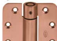
Titanium copper (IN.05.041.125.TCO)