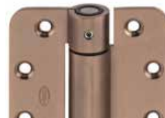
Titanium chocolate (IN.05.041.125.TCH)