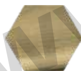
TITANIUM GOLD RB08M.TG (satinado/ satin/ satin)