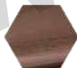
TITANIUM COOPER RB08M.TCO (satinado/ satin/ satin)