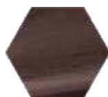
TITANIUM CHOCOLA TE RB08M.TCH (satinado/ satin/ satin)