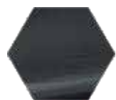
TITANIUM BLACK RB08M.TB (satinado/ satin/ satin)

Titanium special finish / Acabados especiales en titanio