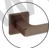
Titanium Chocolate (IN.00.178.QC08M.TCH)