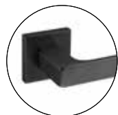
Titanium Black (IN.00.178.QC08M.TB)

Acabamentos especiais / Acabados especiales / Special finish