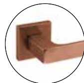
Titanium Copper (IN.00.178.QC08M.TCO)