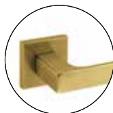
Titanium Gold (IN.00.178.QC08M.TG)