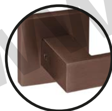
.TCH TITANIUM CHOCOLATE