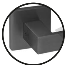
.TB TITANIUM BLACK

Outros acabamentos/ Other finishes/ Otros acabados