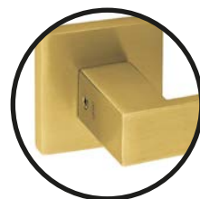
.TG TITANIUM GOLD